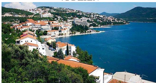
NEUM – rejs statkiem 17.04.2018