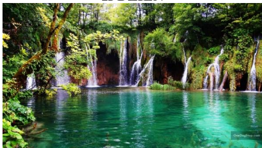
PLITVICKIE JEZIORA 13.04.2018