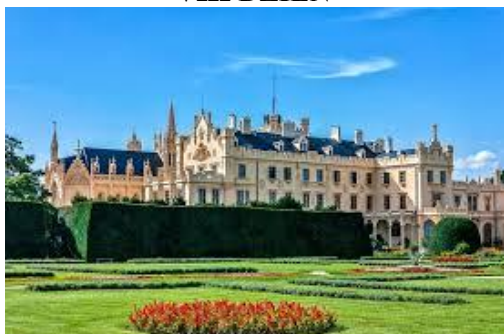
LEDNICE ogrody pałacowe 19.04.2018