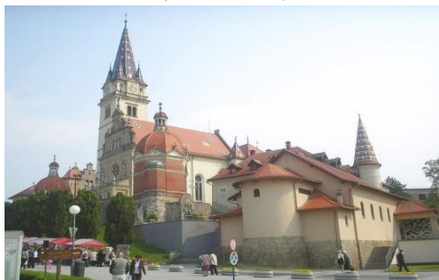
MARIA BISTRICA 18.04.2018